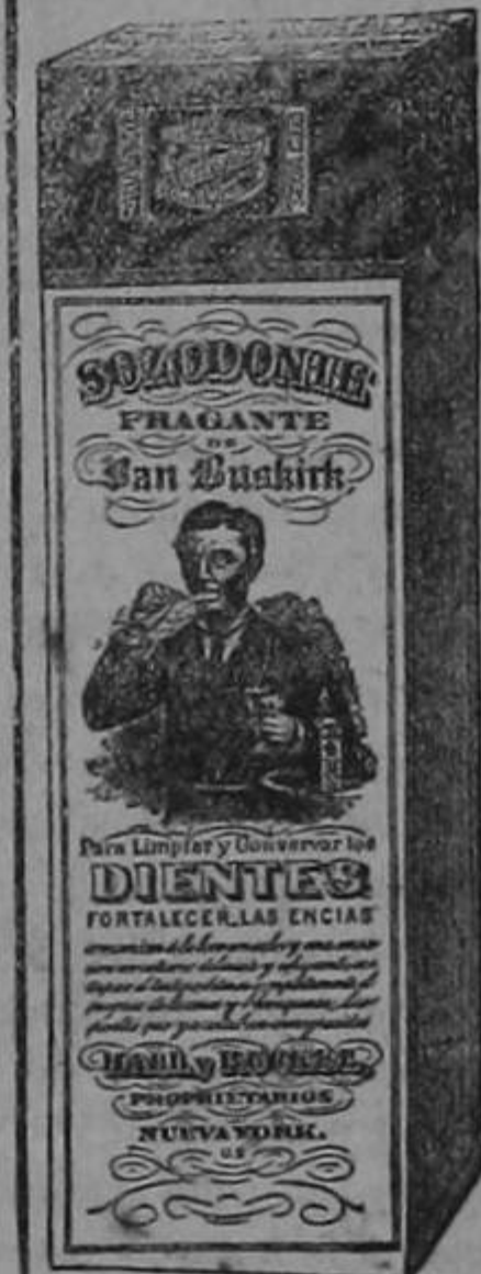
Esta es la figura exacta del paquete segun se vende.

215 Washington St., New York, EE. UU. de A.